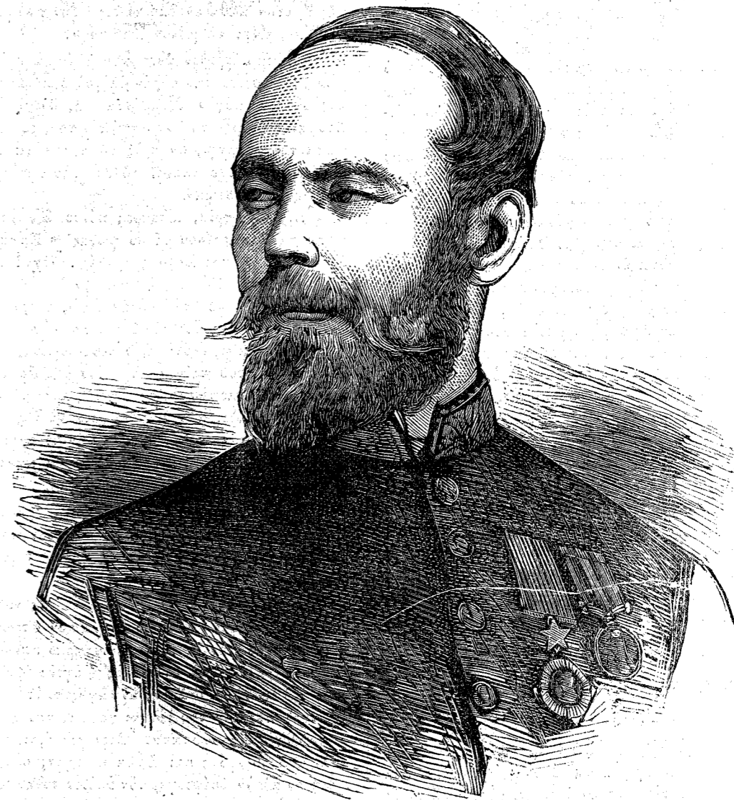
Ο ΤΑΓΜΑΤΑΡΧΗΣ ΣΙΡ ΛΟΥΔΟΒΙΚΟΣ ΚΑΒΑΝΙΑΡΗ

εἰσῆλθεν εἰς τὴν ὑπηρεσίαν τῆς Ἑταιρίας τῶν Ἀνατολικῶν Ἰνδιῶν καὶ ὑπηρετήσεν εἰς διάφορα τάγματα τοῦ ἐκεῖ ἀγγλικοῦ στρατοῦ τιμηθεὶς καὶ διὰ τοῦ σταυροῦ τῆς Βικτωρίας διὰ τὴν τολμηρὰν αὐτοῦ σύλληψιν συμμορίας φονέων τὸ 1876, παρὰ τὸ Ἀβαζῆ τῶν Ἰνδιῶν. Συνώδευσεν τὸν σὶρ Νεβίλ Chamberlain κατὰ τὴν ἀποστολὴν αὐτοῦ παρὰ τῷ Ἐμίρη Σχέρ Ἀλῆ, καὶ ἐπροχώρησε μετὰ μικρᾶς συνοδείας ἱππέων ὅτε